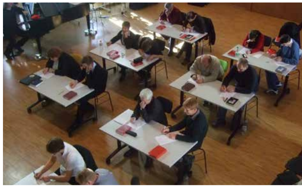
Klausur in Colditz

Lange Zeit gab es in Sachsen keine Möglichkeit für Posaunenchorleiter, eine zertifizierte Prüfung abzulegen. Erst 2011 wurde der bisherige Abschluss, der „Befähigungsnachweis“ in der SPM eingeführt. Mit der D-Prüfung entfällt er künftig.