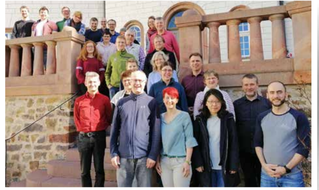
Chorleiterlehrgang im Schloss Colditz

Am Ende steht eine schriftliche Klausur und die praktische Prüfung im Heimatposaunenchor an. Natürlich ist es auch weiterhin möglich, den Chorleiterlehrgang zu besuchen ohne eine Prüfung abzulegen.